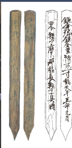
みやくぼ 宮久保遺跡出土の木簡 (綾瀬市)