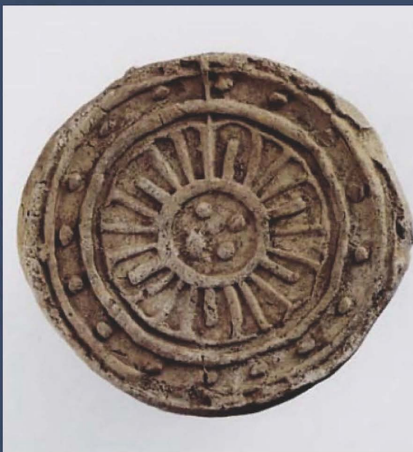
のきまるがわら 相模国府関連遺跡出土の軒丸瓦 (平塚市)