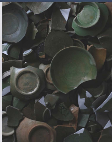
りよくゆうとうき 相模国府周辺出土の緑釉陶器 (平塚市)