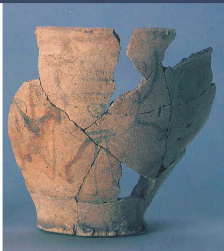
しちどうがらんあど 七堂伽藍跡出土の人面墨書土器 (茅ヶ崎市)