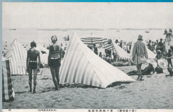
絵葉書「(茅ヶ崎名勝)茅ヶ崎海水浴場」