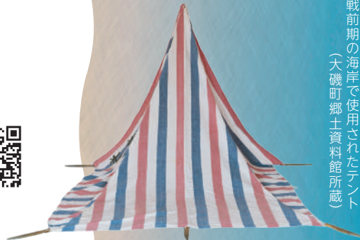
戦前期の海岸で使用されたテント (大磯町郷土資料館所蔵)

1960年代、湘南サウンドが登場し、茅ヶ崎をはじめとした湘南の海と音楽に注目が集まりました。 本特別展では、それ以前の時期、とりわけ茅ヶ崎に海水浴場が開設された明治時代後期以降、海と音楽をめぐる文化がどのような歩みをたどったのか、その歴史を覗いてみます。