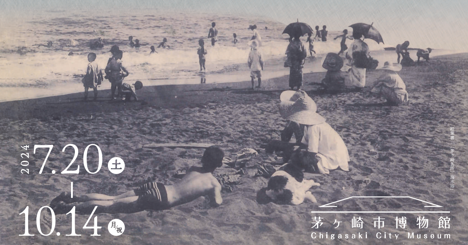
絵葉書「茅ヶ崎名所」海水浴

—「解説」(『童謡百曲集』)、昭和2年(1927)4月4日、茅ヶ崎南湖の居にて (『山田耕筰全集4 歌曲4』第一法規出版、1964年)