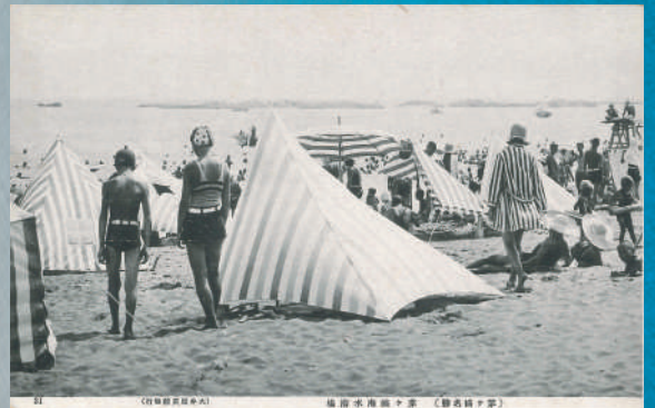
絵葉書「(茅ヶ崎名勝)茅ヶ崎海水浴場」