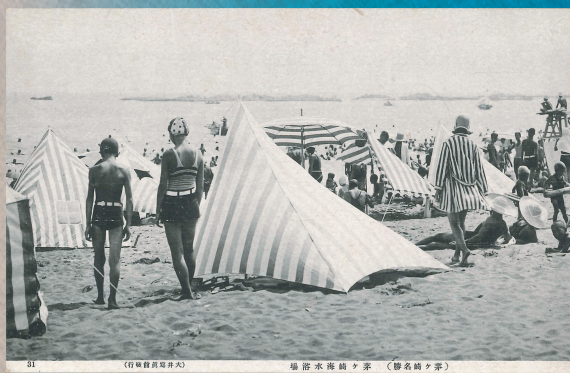
絵葉書「(茅ヶ崎名勝)茅ヶ崎海水浴場」