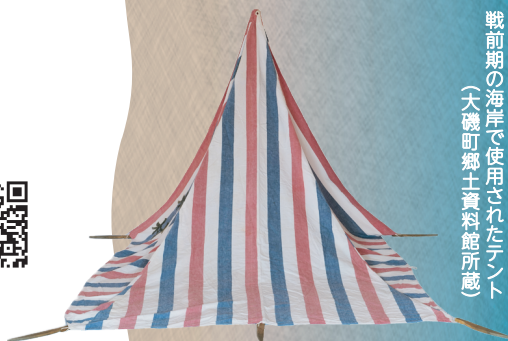
戦前期の海岸で使用されたテント