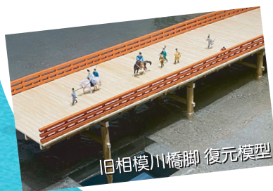
旧相模川橋脚 復元模型

時間 13:30~15:30 対象 どなたでも 申込 不要(開催時間中 にお越しください)